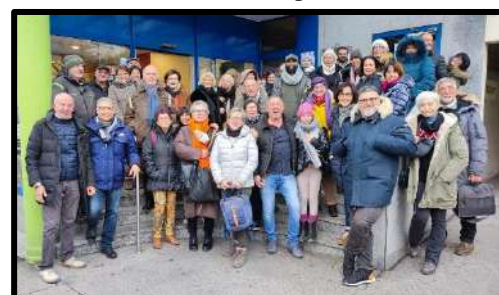
VIENNE – Décembre 2022