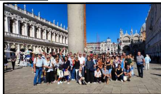
VENISE – Septembre 2022