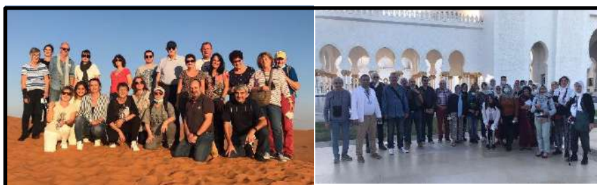
DUBAI et l'Exposition Universelle – Janvier 2022