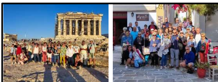
GRECE : ATHENES et les Cyclades – Octobre 2022