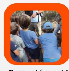
Chasse au trésor sur tablette