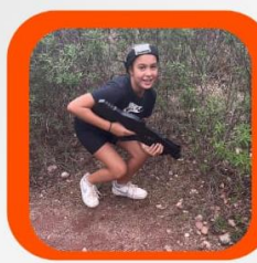
Laser game outdoor